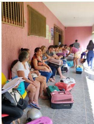
Atendimento clínico e acolhimento de beneficiários com animal assistido.

Apresenta-se, a seguir, registro fotográfico ilustrativo das etapas de triagem, acolhimento, atendimento clínico, preparação cirúrgica, pós-operatório e devolução responsável dos animais atendidos, como reforço comprobatório da execução material do projeto.