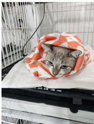
Preparação pré-cirúrgica de paciente para procedimento eletivo.