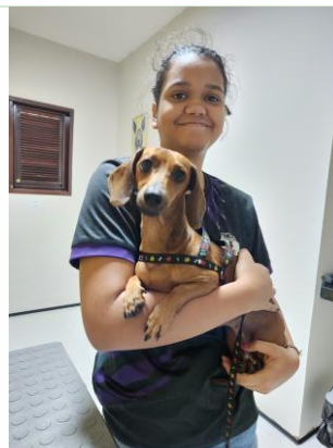
Triagem e orientação pré-procedimento em ambiente ambulatorial.