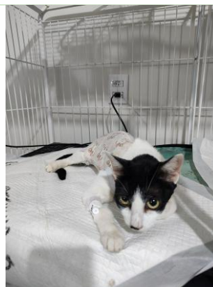
Consulta veterinária e registro clínico durante a execução do projeto.